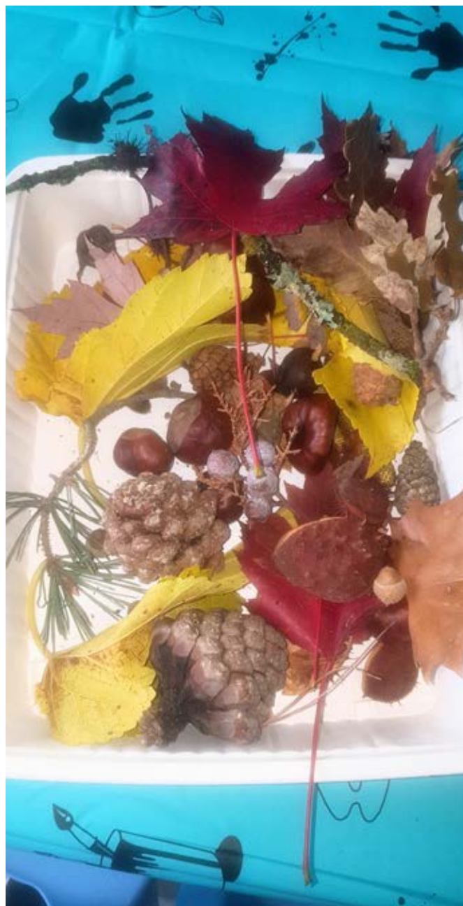
Bac sensoriel (exemple)