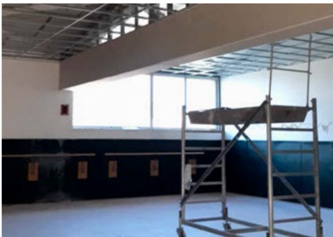
Réfection plafond salle de danse

sur les rails l'enchaînement des travaux et laisse espérer une reprise des activités dans la grande salle pour la mi-janvier. L'aménagement des locaux au premier étage aura un peu plus de retard. Toutefois, tout est mis en œuvre pour mettre, le plus tôt possible, les installations à la disposition des utilisateurs et des organisateurs de manifestations.