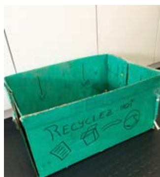
Boîte à recyclage

Parmi les souhaits de l'équipe : création d'un potager et mise en place d'un mini poulailler pour récupérer les déchets de la cantine.