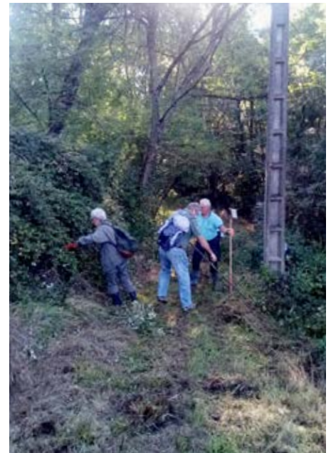
Bois du Foumelou

Conformément à notre engagement de préservation et d'aménagement des espaces verts, la commune de Gratentour s'est lancée dans une opération d'aménagement du bois du Foumelou.