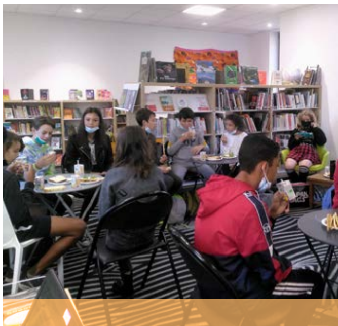
P'tit dej culture avec les ados et la MDJ