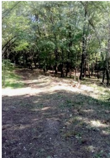
Après le débroussaillage