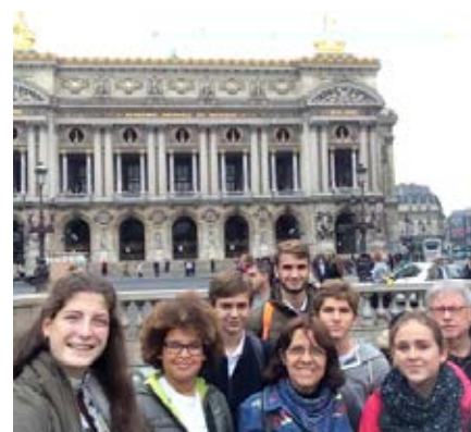
Visite de l'Assemblée nationale à Paris

Je souhaite devenir professeur d'histoire ou documentaliste. Après mes études, j'aimerais pouvoir m'installer ici, à Gratentour, rejoindre le Conseil municipal en 2026, être dans les commissions d'environnement, de communication, de culture, de sécurité, de vie sociale, de sport et bien d'autres encore » !