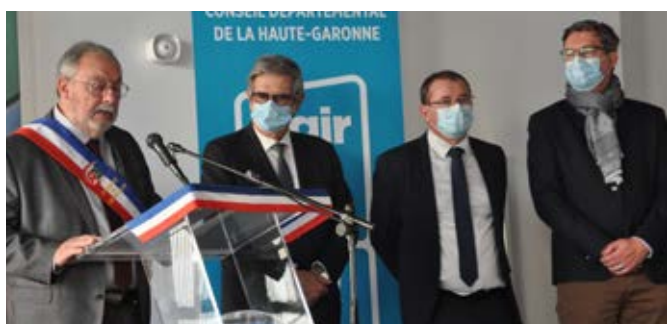
Discours M. le Maire

En fin de discours, le Maire remercie l'ensemble des institutions qui ont apporté leur soutien et leur aide financière (voir tableau) pour la réalisation de ces deux projets ainsi qu'architectes, entreprises et parents d'élèves sans oublier, élus, agents, et partenaires pour l'organisation de cette cérémonie... un vrai moment de convivialité partagé par les 110 invités présents.