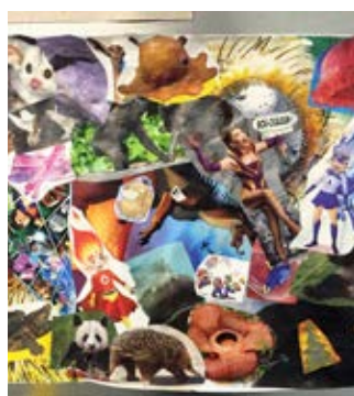
Patchwork à partir de magazines