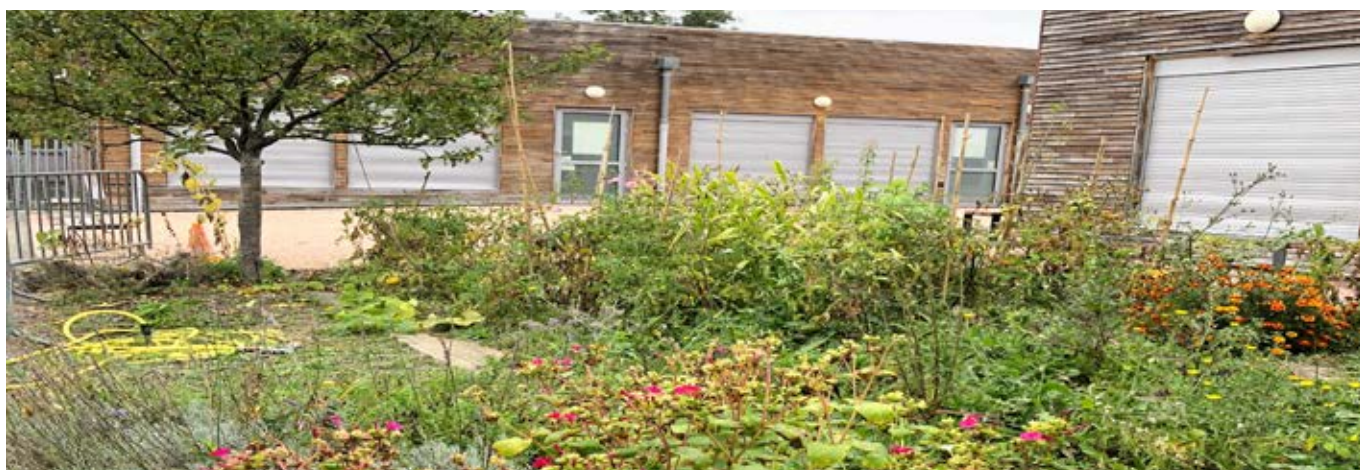
Potager de Maurice-Saquer

De quoi les responsabiliser et les régaler tout au long de l'année !