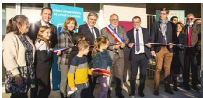
Coupure de ruban - École Thomas PESQUET