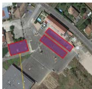
Parking Stade et Skate park

Vous pourrez d'ici quelques semaines découvrir le début de ces travaux, pilotés par OMBRIÈRES D'OCCITANIE et l'AREC.