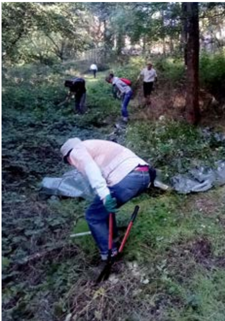
Débroussaillage bois du Foumelou / Avant