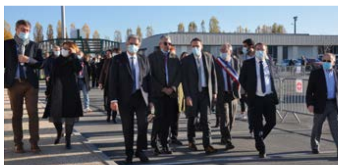
Les partenaires de la commune