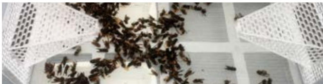
Piège à frelons

Une nouvelle animation café-brico sera aussi organisée au café municipal L'Entrepotes en ce début d'année pour vous permettre de connaître ces nouveaux pièges et pour les assembler dans une atmosphère conviviale et participative.