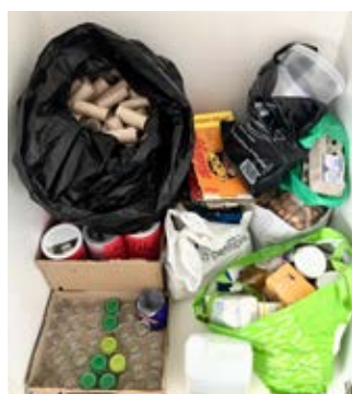
Stock d'objets à recycler