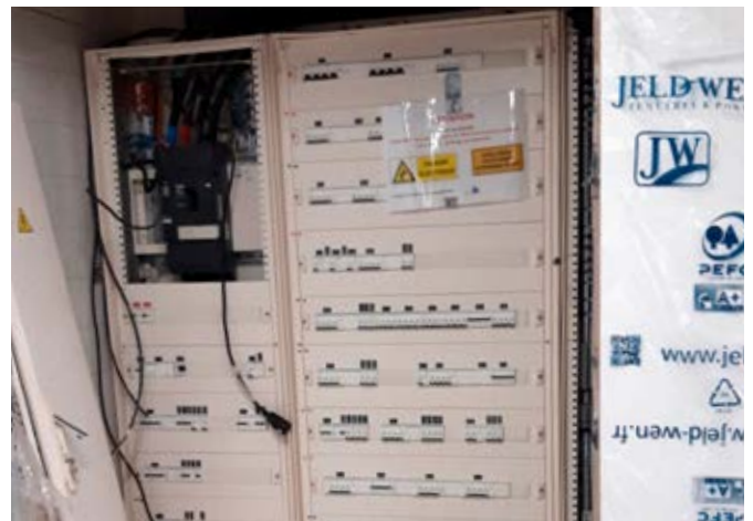
Vue sur le TGBT de la salle culturelle