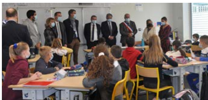
Visite école - classe élémentaire

La visite du groupe scolaire THOMAS-PESQUET a été l'occasion d'un échange direct en classe avec les élèves qui ont pu poser leurs questions aux élus et exprimer leur créativité à travers des chants et des fresques en lien avec l'univers de l'espace et des spationautes.