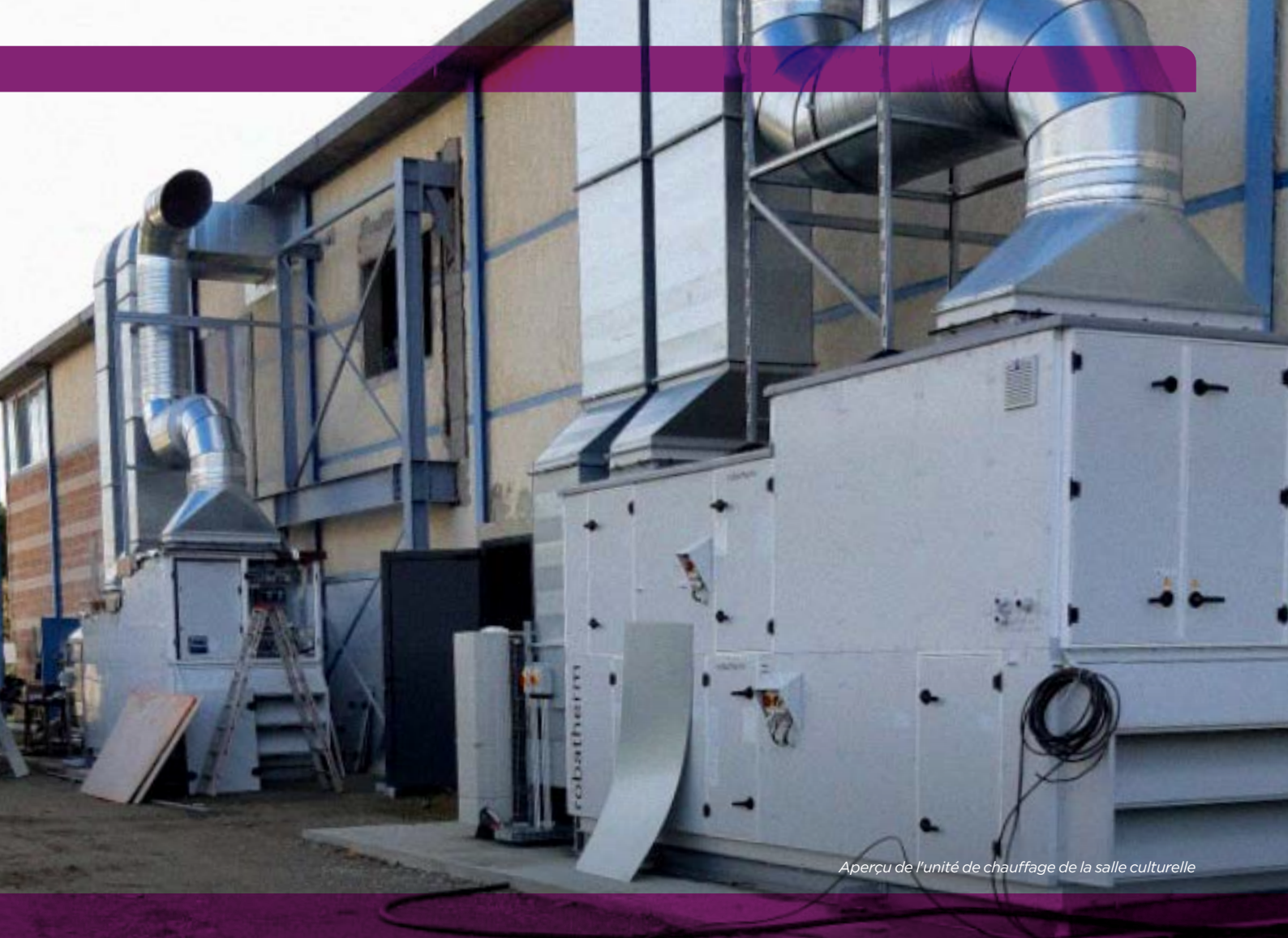
Aperçu de l'unité de chauffage de la salle culturelle