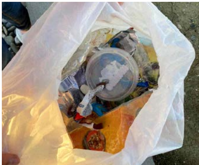
Nettoyage par des enfants au City stade

En octobre, des enfants de 5 à 10 ans ont spontanément ramassé des débris laissés aux abords du City stade, certainement par des jeunes qui profitent également du lieu. Les enfants ont pu remplir deux sacs poubelles de déchets alors même que les services de la mairie nettoient régulièrement le lieu.