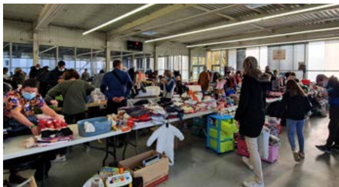
Vide dressing / bourse aux jouets

Le CCAS invite chaque année les seniors (plus de 65 ans), à un repas dansant pour un moment de détente et de convivialité. S'ils ne peuvent participer au repas, un petit colis festif leur est proposé.