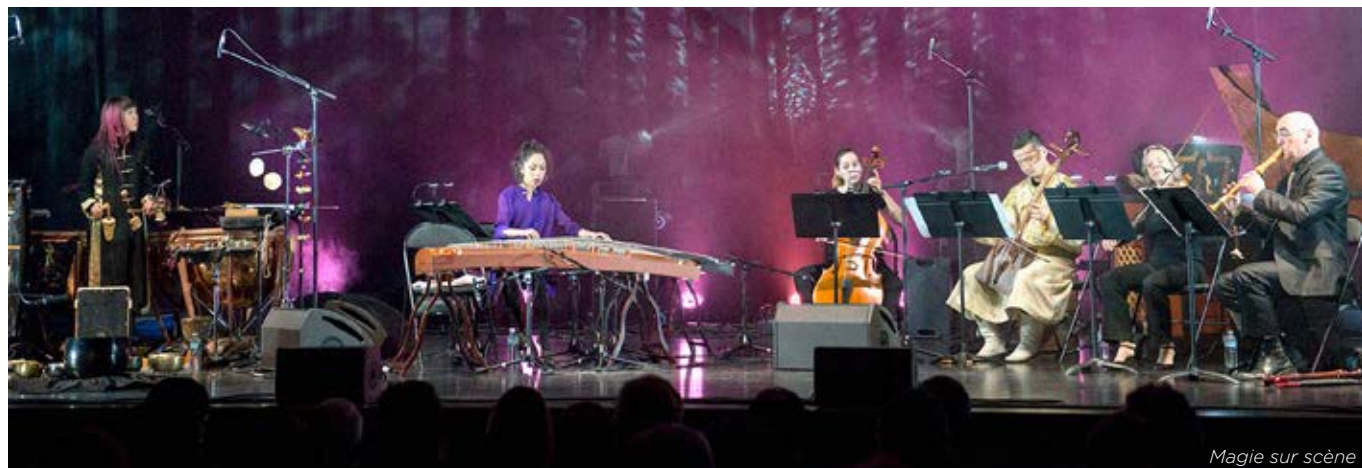
Magie sur scène