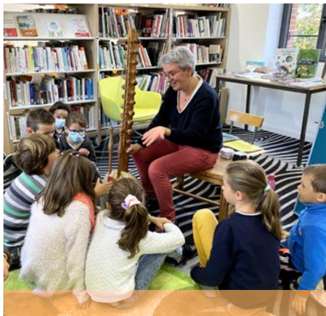
Atelier en lien avec le Muséum

Notre ami « Zébulon » fait parler de lui ! Compagnon de toutes les sorties dans les écoles, crèche, RAM... Il s'exporte aussi en formation, à Labège, où tout le monde nous l'envie !!