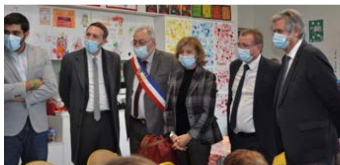
Visite école - classe maternelle