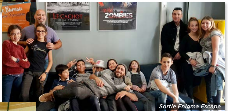
Sortie Enigma Escape

Comité des fêtes Après-midi belote le samedi 20 octobre 2018