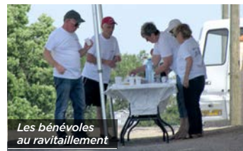
Les bénévoles au ravitaillement