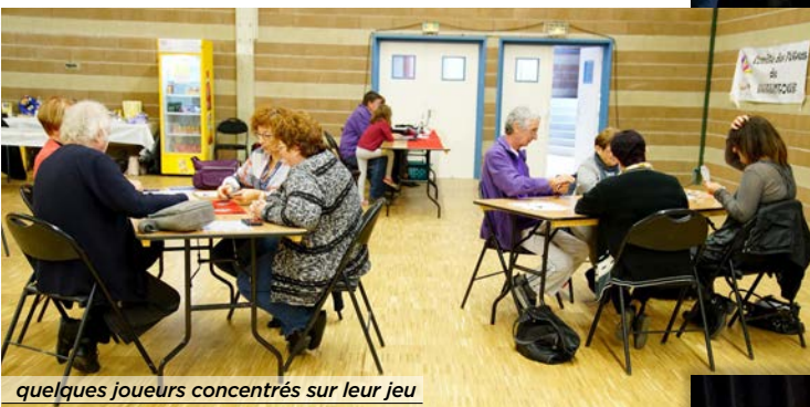
quelques joueurs concentrés sur leur jeu

Comité des fêtes Après-midi belote le samedi 20 octobre 2018