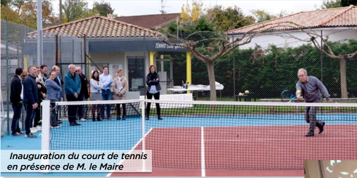
Inauguration du court de tennis en présence de M. le Maire

Rénovation du court n°1 du Tennis Club de Gratentour Le court a été refait à neuf durant l'été