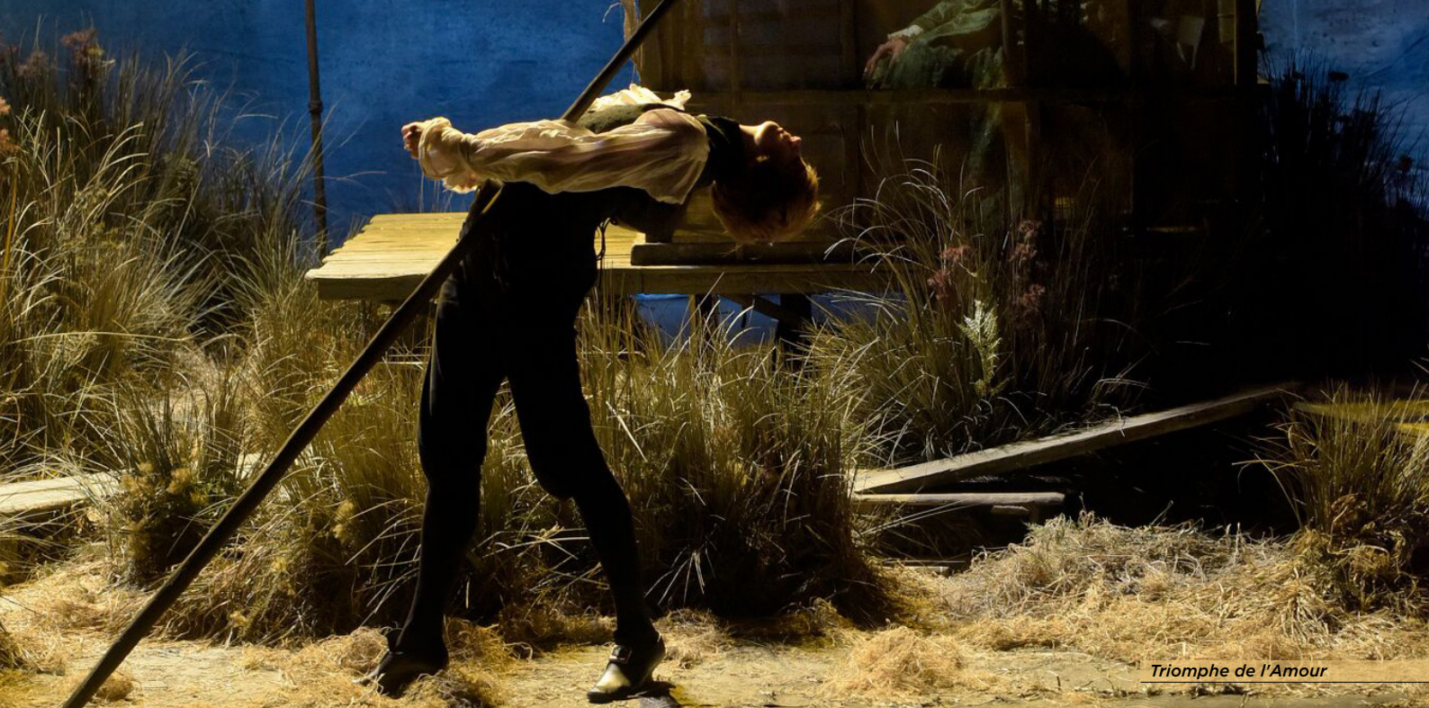
Triomphe de l'Amour