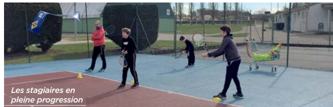
Les stagiaires en pleine progression