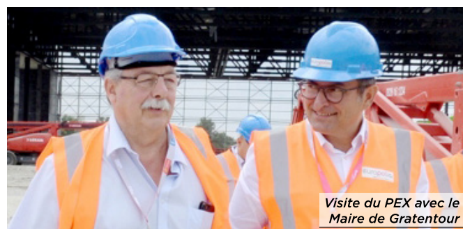
Visite du PEX avec le Maire de Gratentour