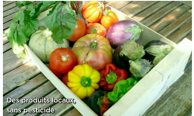
Des produits locaux, sans pesticide

Associations pour le Maintien d'une Agriculture Paysanne