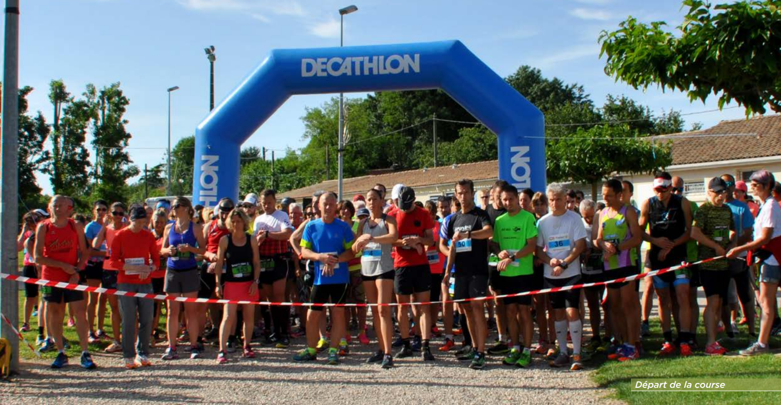
Départ de la course