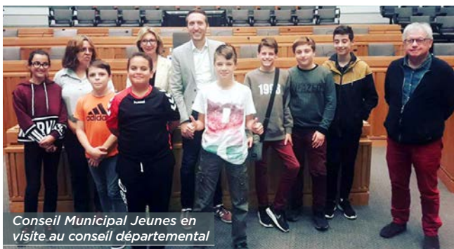
Conseil Municipal Jeunes en visite au conseil départemental