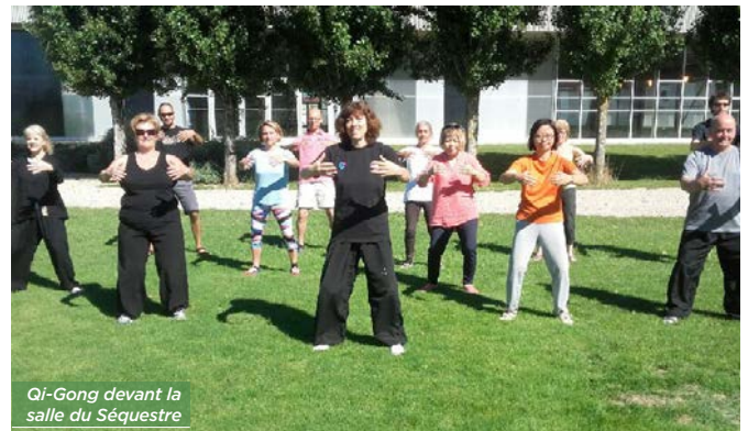
Qi-Gong devant la salle du Séquestre