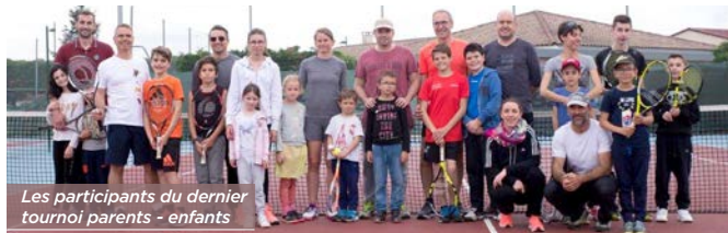
Les participants du dernier tournoi parents - enfants