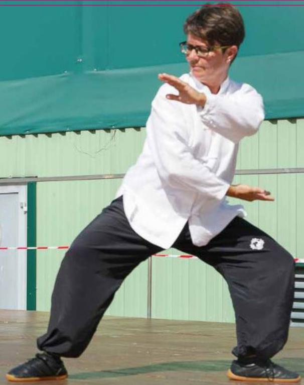
Taïchi Chuan au forum des associations